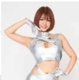
ENA (VELOREX アンバサダー)