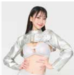
YUYU (VELOREX アンバサダー)